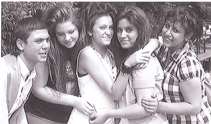
Auf der Suche nach der richtigen Berufsausbildung: Rallye-Teilnehmer/innen beim Abschlussfest am 24.6.2010

Bis zum Nachmittag waren die Teilnehmer/innen der Alfa-Berufswahlrallye aus verschiedenen Luruper Schulen am 24. Juni in Hamburg unterwegs. Sie sprachen mit Mitarbeiter/innen der Haspa, der Deutschen Bank oder vom HVV, waren bei der Agentur für Arbeit oder beim Diakonischen Werk. Ziel der Aktion war herauszufinden, welche Berufe für die Schüler/innen interessant sein könnten. „Ist der Job anstrengend?“ haben sie gefragt und: „Wieviel Geld kann man verdienen?“ „Ist ein Bürojob für mich spannend oder werde ich lieber Tanzpädagogin?“ Zum Abschluss der Rallye feierten alle gemeinsam bei schönstem Wetter vor dem Stadtteilhaus und hatten viel zu erzählen. Organisiert wurde die Rallye vom Job Club Altona im Rahmen des Projekts „Agenten in Lurup für Ausbildung“.