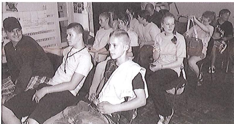
Die jungen Unternehmer/innen kurz vor der Präsentation ihrer Geschäftsideen