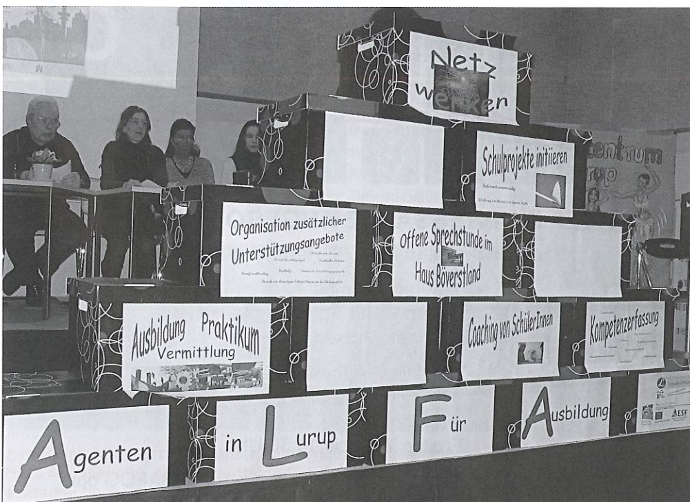
Präsentation einmal anders: die Bausteine des ALFA-Projekts

An jeder Schule wird eine Mitarbeiterin des ALFA Teams eingesetzt. Sie bietet vor Ort in Absprache mit der Schule einen Mix aus individueller Unterstützung, An-